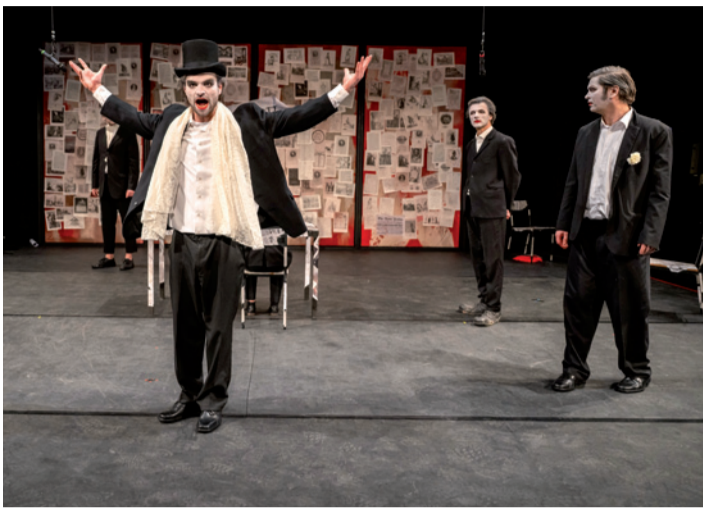
↑ DANTONS TOD