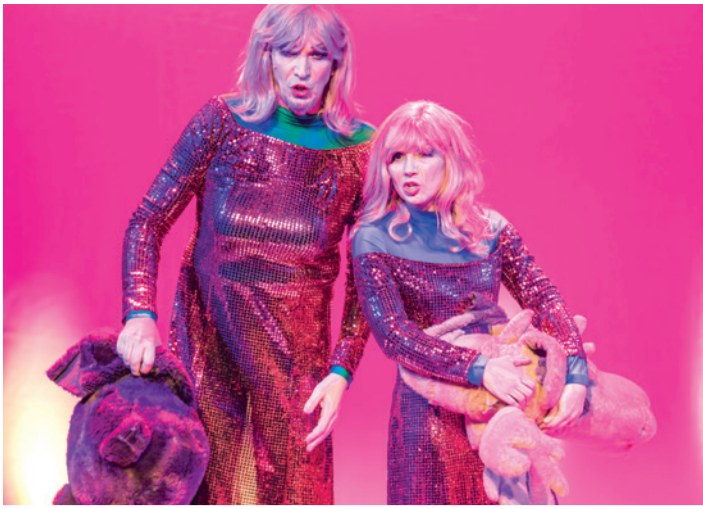
↑ ICH GLAUB', 'NE DAME WERD' ICH NIE